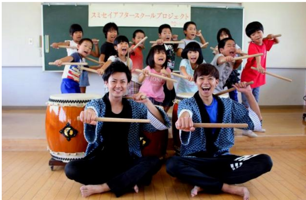
【和太鼓の響き】平成28年8月4日岡山県浅口市にて実施

※「スマイセイアフタースクールプロジェクト」は、厚生労働省主催の「第4回健康寿命をのぼそう！アワード（母子保健分野）」において、厚生労働大臣最優秀賞を受賞いたしました。また、第8回キッズデザイン賞を受賞しています。