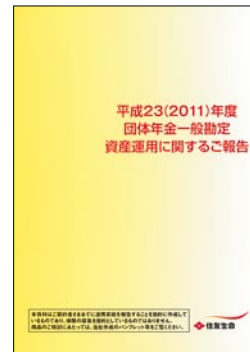
平成23(2011)年度 団体年金一般勘定 資産運用に関するご報告