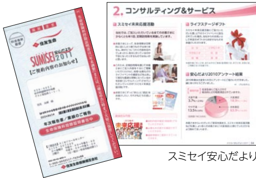
スミセイ安心だより