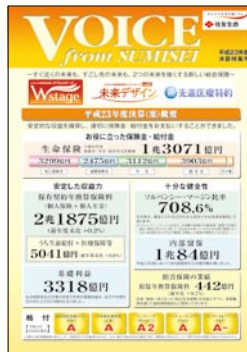
VOICE from SUMISEI 平成23年度決算特集号