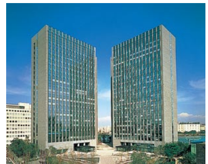
三井住友海上本社ビル