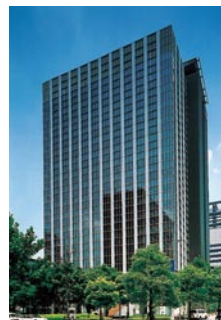
住友生命本社ビル