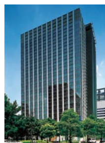
住友生命本社ビル