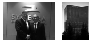
マツラCEOと橋本社長

収益基盤の強化やリスク分散、米国市場の成長性の享受等を通じ長期的な契約者利益の向上を目指し米国に進出。