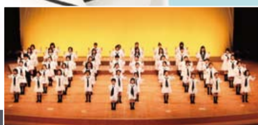
松江プラバ少年少女合唱隊 [プロフィール]

1986年プラバホール竣工とともに結成。2001年在籍の中学生とOGでPure Blueberryを結成。2005年幼児クラスプラバポップキャンティーズを結成。幼児から高校生、OGと、現在約80名在籍。外国の少年少女合唱団との共演、リサイタル、市内外のイベントに多数出演し、レパートリーは宗教曲からミュージカル、ダンス付きポップスまで幅広い。定期演奏会ではミュージカル「ガラスの靴」「サウンドオブミュージック」オペラ「ヘンゼルとグレーテル」、シアターピースを上演。2002年全日本ジュニアコーラスフェスティバル横須賀大会、講師賞。2004年ミクローシュ・コチャール合唱コンクール銀賞。2005年プラバ室内合唱コンクール・大賞。2008年宝塚国際室内合唱コンクールフォーカア部門金賞・シアターピース部門銀賞。平成17年度島根県文化奨励賞受賞。