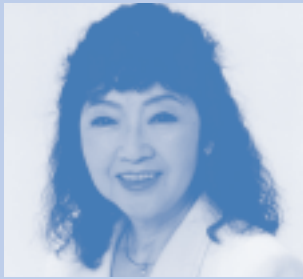
2007年、福島、山形県開催オンステージのご意見・ご感想より抜粋