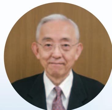
長谷川 和夫 氏 (はせがわ かずお) 認知症研究の世界的権威