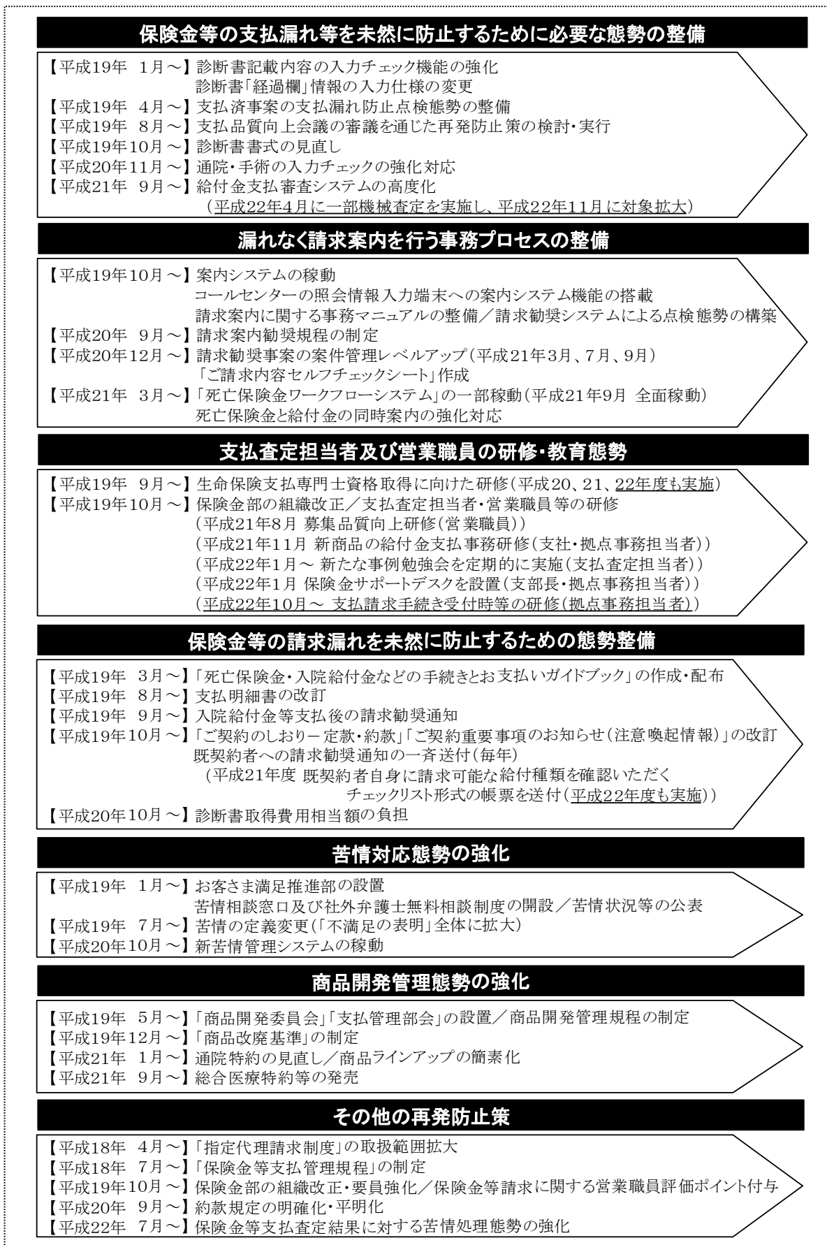
図3 保険金等の支払漏れ等に係る再発防止策等の必要な見直し及び改善<概要>