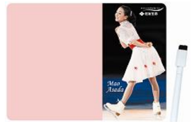
マグネットボード

CM関連情報やキャンペーン情報を住友生命公式 Facebook ページでも近日公開予定です。