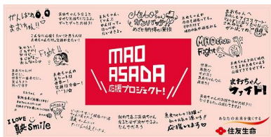
MAO ASADA 応援プロジェクト特製タオル