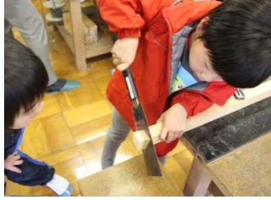
「木のぬくもり、不思議を知ろう」