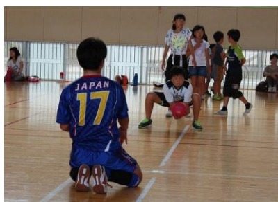
「Let's play ドッジボール！」