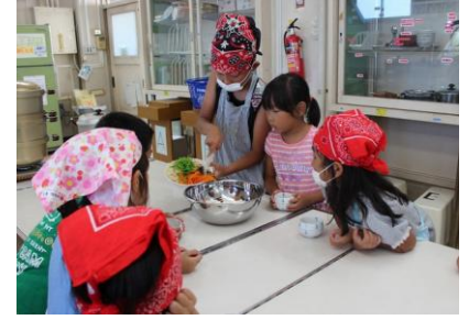
「無形文化遺産“和食”」