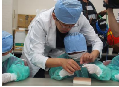
「心臓外科医のシゴト」