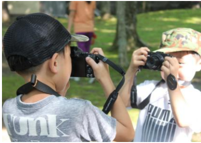
「ファインダーから見るいのち」