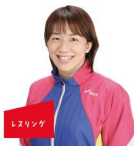
浜口 京子さん 女子レスリング選手

現時点でご協力が確定しているアスリートの皆さまをご紹介します。さらに多くのアスリートの皆さまにご協力いただく予定です。