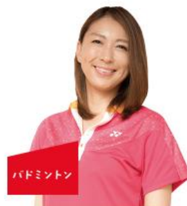
小椋 久美子さん 元女子バドミントン日本代表