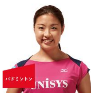
奥原 希望さん 女子バドミントン日本代表