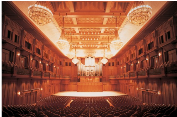
住友生命いずみホール

住友生命、Olive Union、福祉文化財団は今回の取組みを通じ、一人ひとりのよりよく生きる＝ウェルビーイングの貢献に挑戦します。