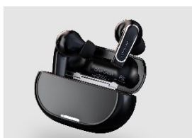
オリーブスマートイヤヤー プラス