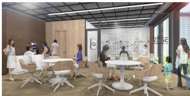
新拠点内イメージ①