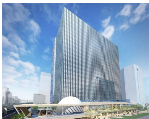
横濱ゲートタワー外観（イメージ）