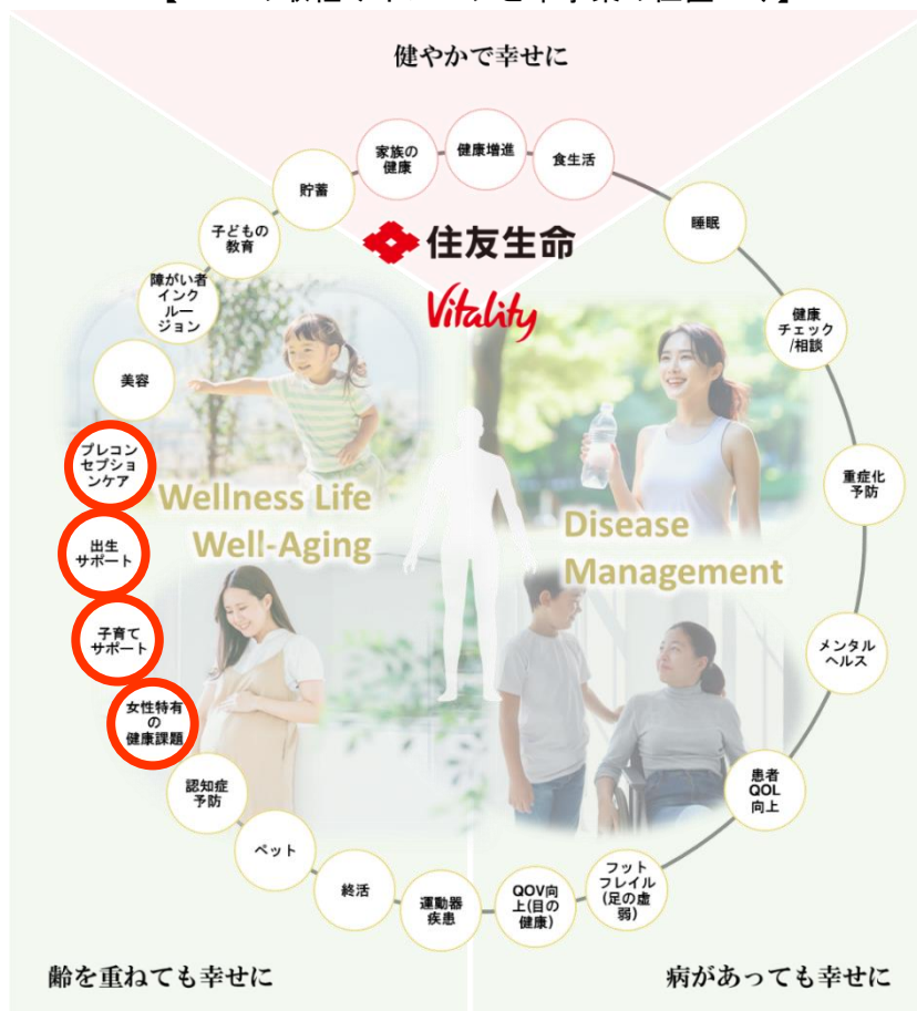
【WaaS の取組みイメージと本事業の位置づけ】

※3 Vitality 健康プログラムを中心とするウェルビーイングに資するサービスエコシステムのことです。