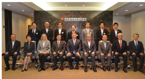
シメトラ幹部の来日時のご本社での集合写真