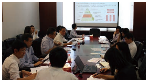
PICC生命での両社部門ミーティング