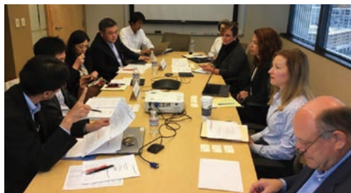
シメトラ本社での両社部門ミーティング