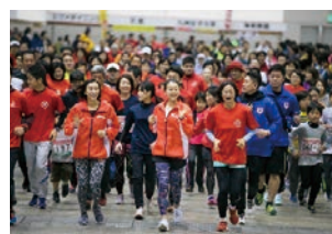
スミセイバイタリティアクション Presents北九州スマイル FUNRUN!