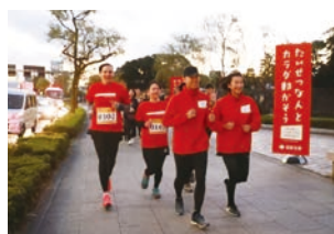
スミセイバイタリティアクション Presentsプレミアム“カラダ” フライデーRUN

平成29年度は様々な種類のトップアスリートによる「親子スポーツイベント」等を全国18箇所および「大規模ランイベント」を2箇所で開催し、毎回好評をいただきました。今年度も「親子スポーツイベント」は更に実施回数を増やし、全国様々な会場での開催を予定しております。親子一緒に運動することで、健康増進を図るとともに、家族の絆も深めていただくきっかけとしていただければと考えています。イベント開催情報については、ホームページにて順次お知らせいたします。