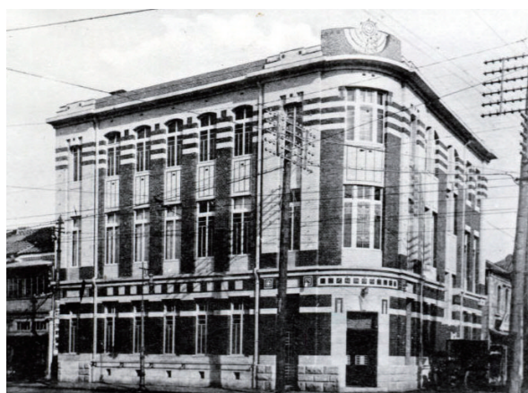
日之出生命本店社屋

日之出生命は会社経営の安泰、保険契約者の利益を第一とした堅実経営を貫き、創業初年度から剰余金を計上するなど、その経営内容は当時小粒ながら「業界のダイヤモンド」と称されました。