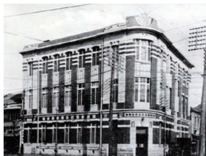
日之出生命本店社屋

日之出生命は会社経営の安泰、保険契約者の利益を第一とした堅実経営を貫き、創業初年度から剰余金を計上するなど、その経営内容は当時小粒ながら「業界のダイヤモンド」と称されました。